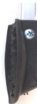
détail du tampon vissé + aimant

conditionnement & logistique genecod 3591683421000 code douane 76169990